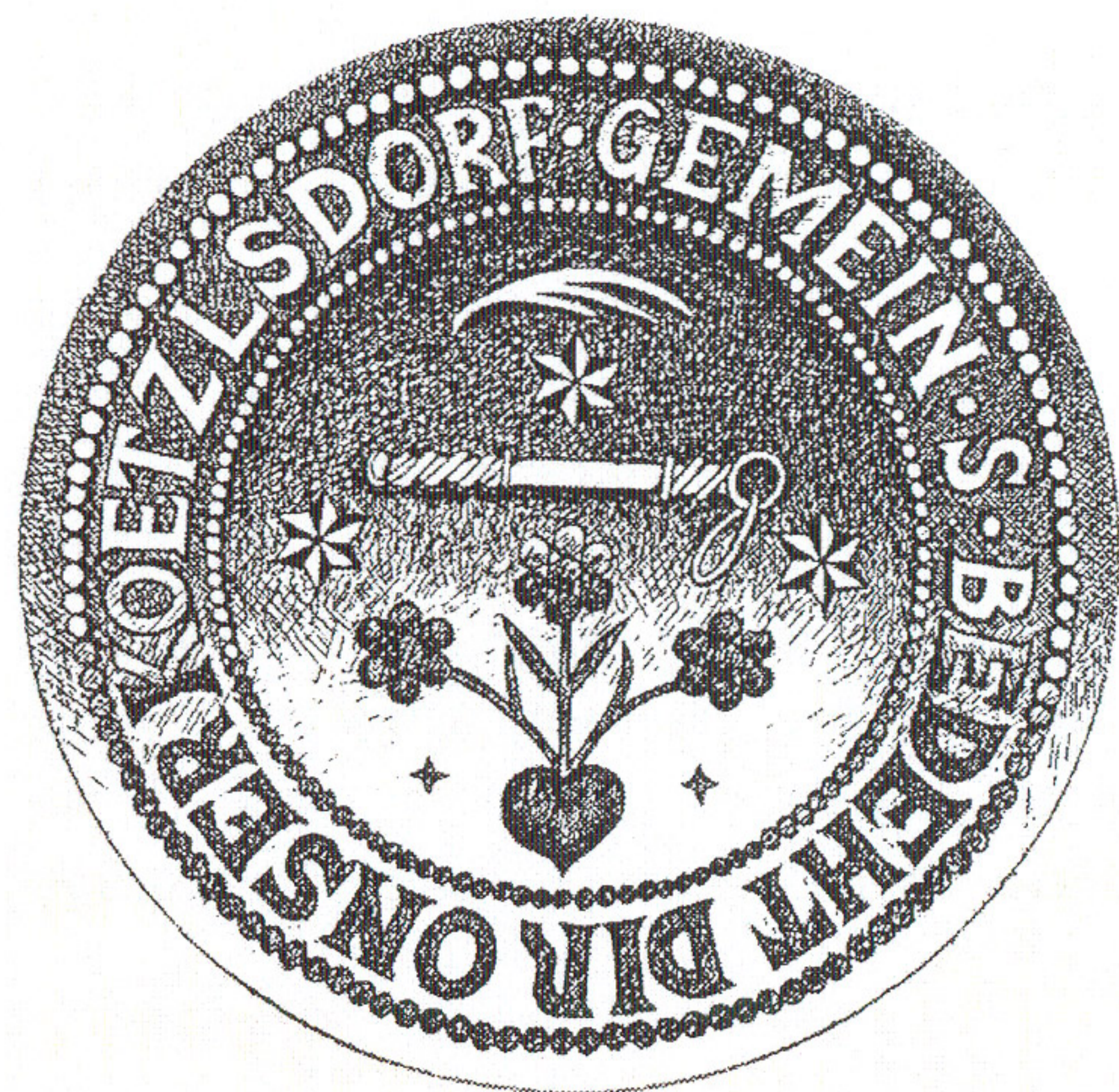
Obecní pečeť z roku 1720